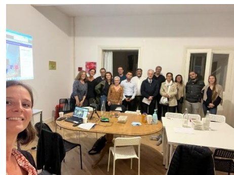
Réunion en octobre 2022 du bureau et du conseil d'administration de la CPTS ADP 94.