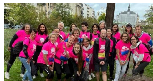
Équipe de professionnels de santé de la CPTS lors de la Course Odysee en octobre 2022.