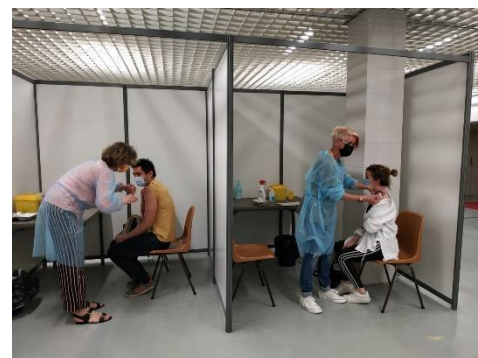
Centre de vaccination de Nogent en 2022, porté par la CPTS Autour du Patient 94.

La CPTS met en œuvre et fait avancer son projet de santé, c'est-à-dire ses actions autour des missions socles: accès aux soins, parcours, prévention, crises sanitaires. Des groupes de travail pluridisciplinaires se réunissent et prennent des décisions collectives. Des rencontres ville-hôpital et avec les partenaires ont lieu. Divers événements sont proposés: soirées thématiques, webinaires.