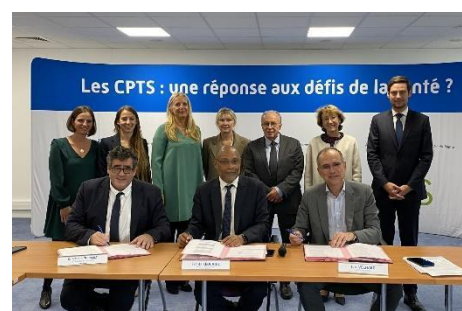
Signature de l'ACI dans les locaux de la CPAM en septembre 2022.