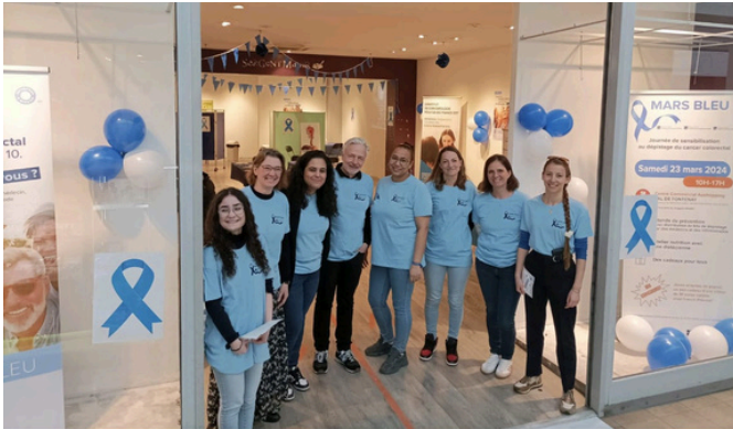
Photo mars bleu 2024 au centre commercial Val-de-Fontenay