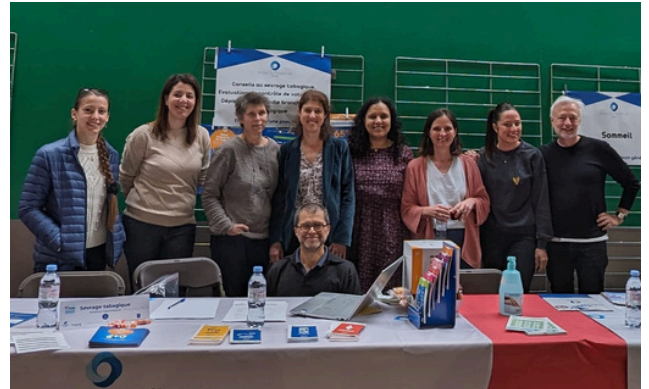
Photo forum santé intercommunal 2024 à Bry-sur-Marne