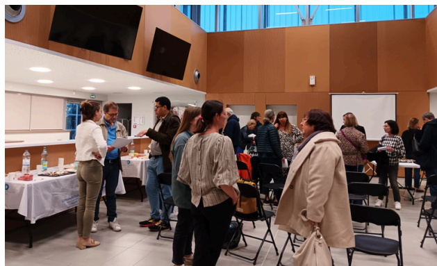
Photo soirée thématique insuffisance cardiaque mai 2024