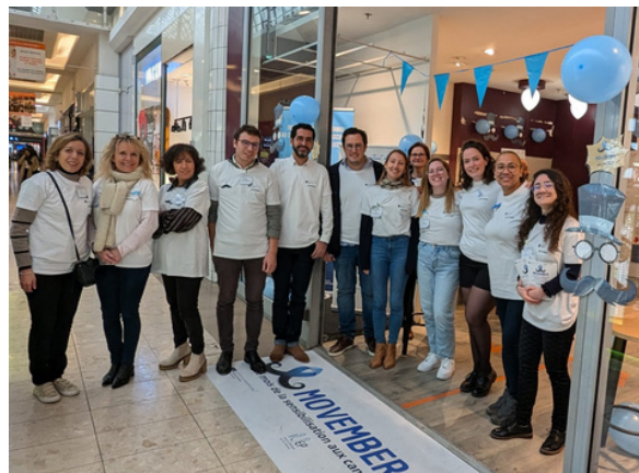
Photo Movember 2024 au centre commercial Val-de-Fontenay