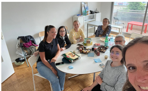
Photo café infirmier juin 2024