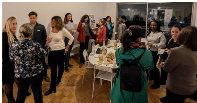
Photo apéro psy octobre 2024