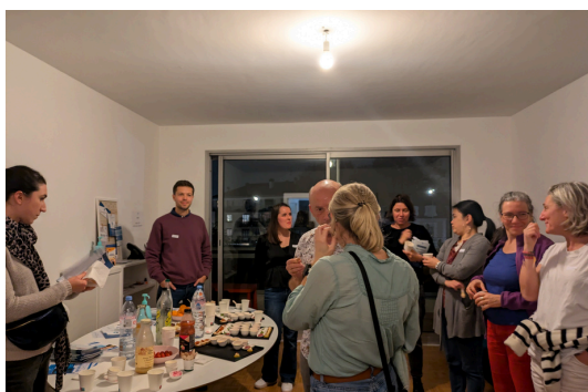
Photo de l'apéro kiné novembre 2024