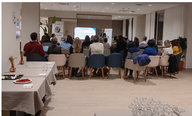
Photo soirée thématique maintien à domicile mars 2024

-Webinaire sur l'outil de communication Idomed le 21/11/2024